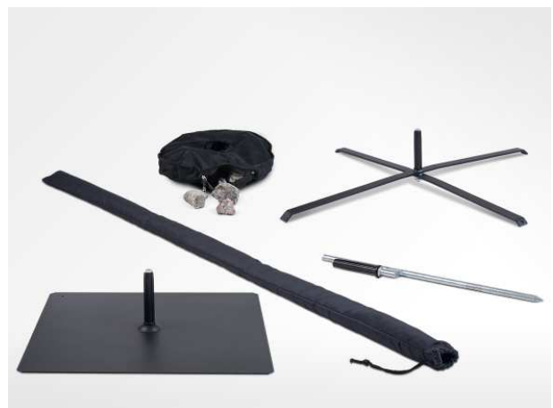
Verschiedene Füße und Transporttasche der PromoFlag