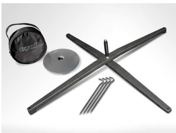
Kreuzfuß des FlagStand Gewicht und Heringe sind optional erhältlich