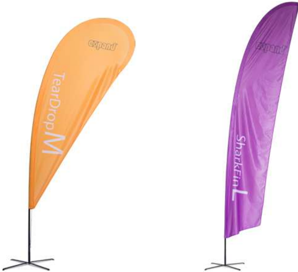
Die PromoFlag ist in der Tropfen- (L) und Federform (R) erhältlich

Bewerben Sie Ihre Produkte oder Ihre Marke bei Outdoor-Events mit der einfach aufzustellenden Expand PromoFlag .