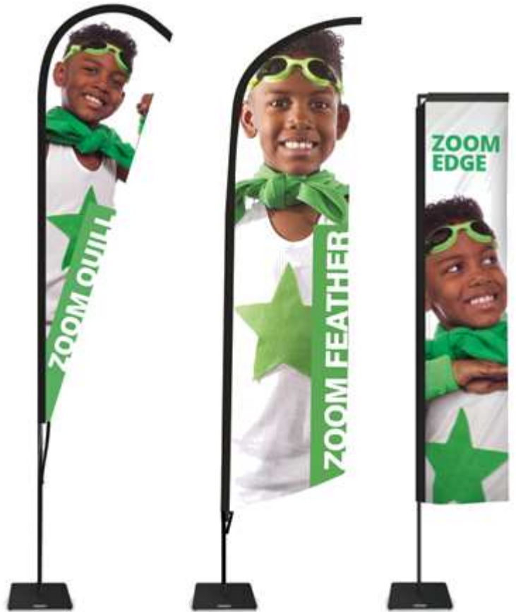
Die Zoom Fahnen sind in Feder- und Tropfenform oder Eckig verfügbar

Die wirtschaftlichen Fahnen Zoom Quill , Feather und Edge sind ideal für Ausstellungen und Veranstaltungen bei denen eine größere Anzahl an Fahnen benötigt wird.