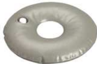
Große Auswahl an Standfüßen