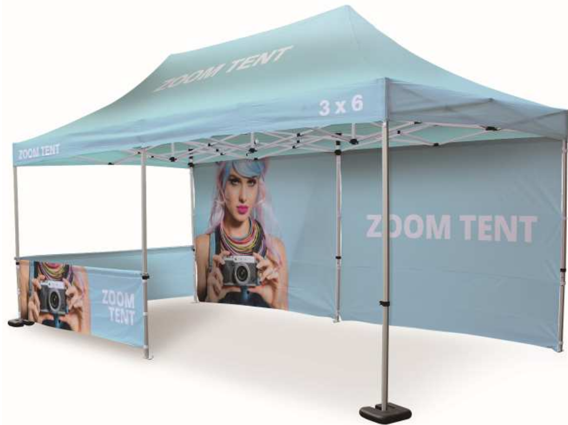
Zoom Tent 3x6 mit Fußgewichten, zwei 3x3 Wänden und zwei halben Wänden