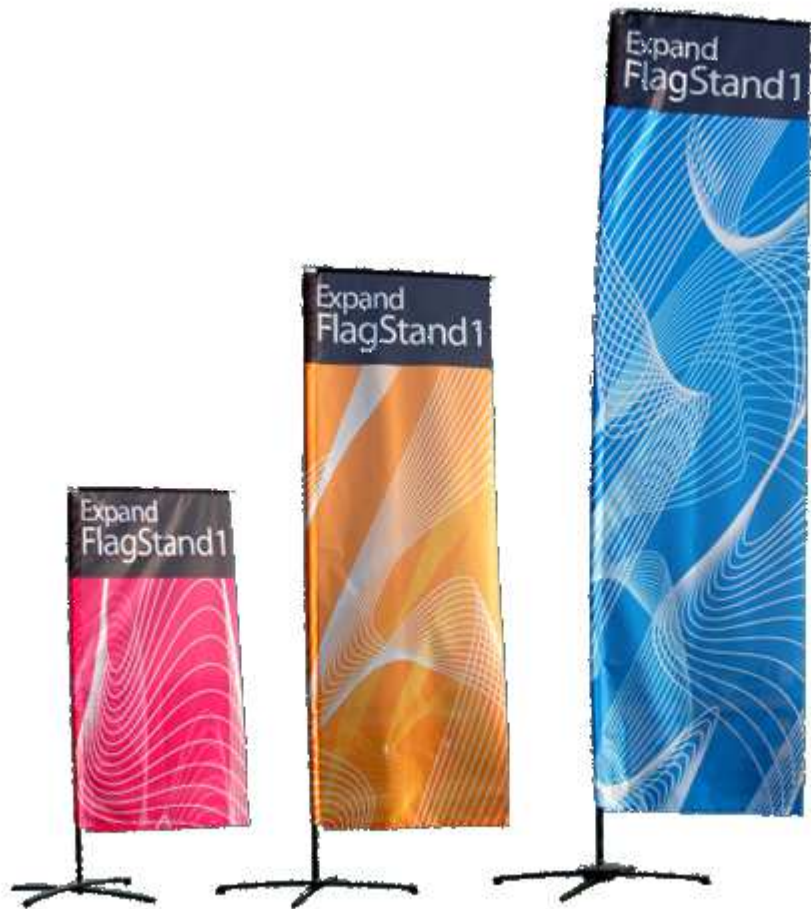
Expand FlagStand ist in 2, 3 und 4m höhe erhältlich