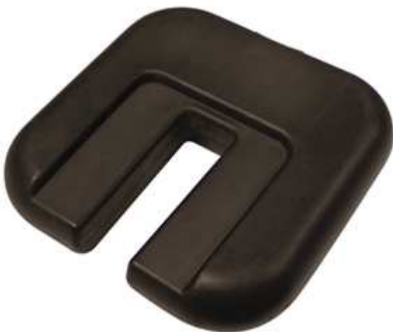
Die Fußgewichte verleihen dem Zoom Tent zusätzliche Standfestigkeit bei starkem Wind

Das Zoom Tent ist die wirtschaftliche Lösung für Werbezelte .