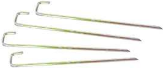
Inklusive Heringen für zusätzlichen Halt