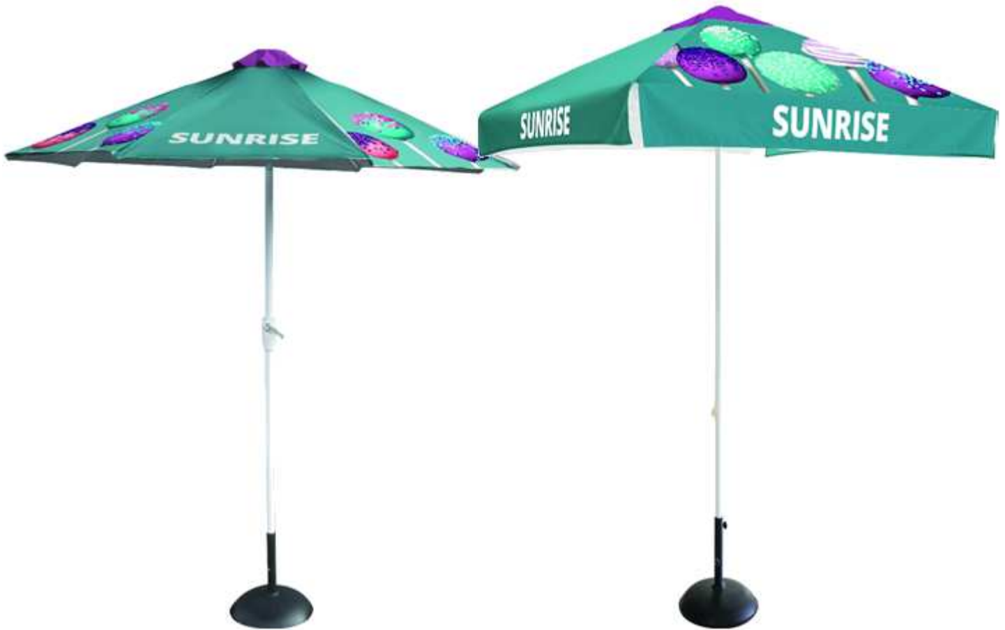
Die Sunrise Sonnenschirme sind in rund und viereckig erhältlich

Die Sunrise Sonnenschirme kombinieren Funktionalität mit zusätzlicher Werbefläche . Den Sonnenschirm erhalten Sie wahlweise in rund oder quadratisch .